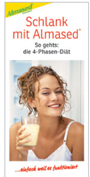
Flyer: Diät mit Almased